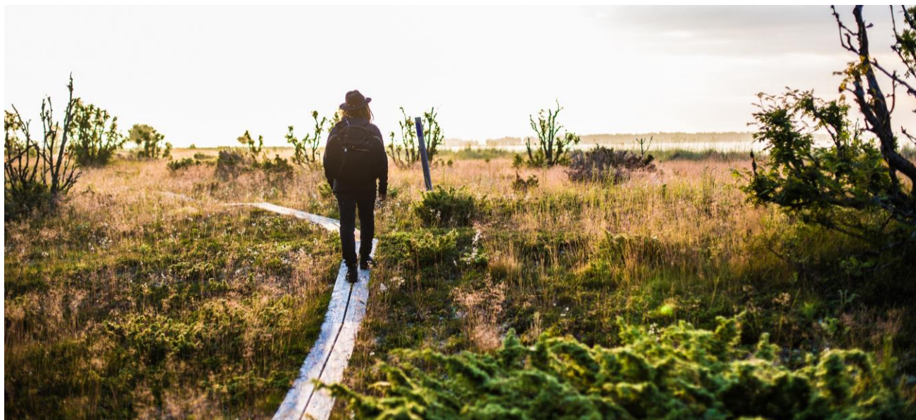
Linnea Isaksson @Follow The Sun Photography